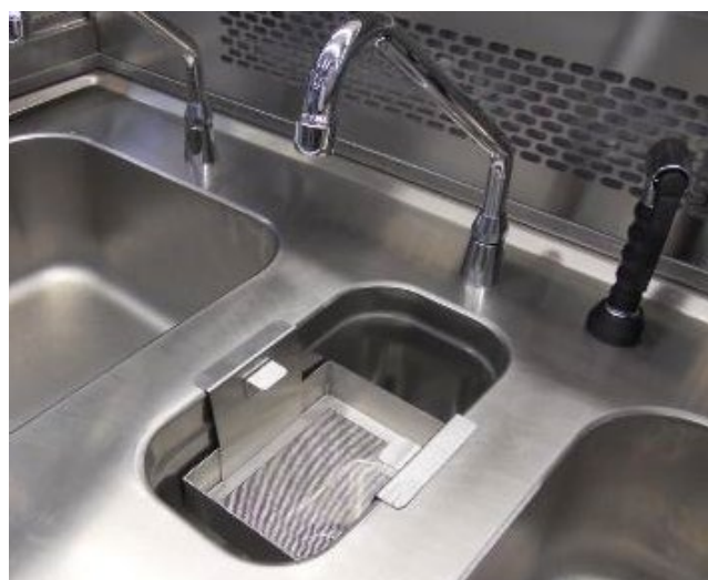
Cesto de filtragem