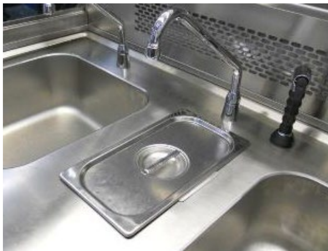
Kryt pre drez na formalín