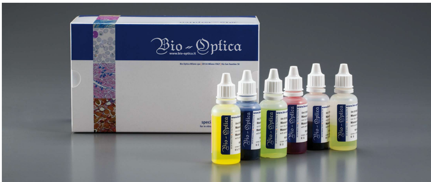
Attēls ir paredzēts tikai ilustratīviem nolūkiem