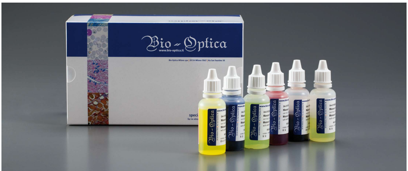
Slika služi samo u ilustrativne svrhe