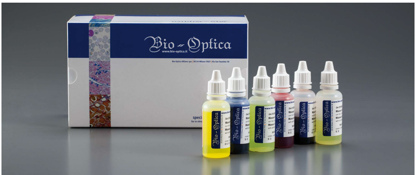
Pilt on illustratiivse tähendusega